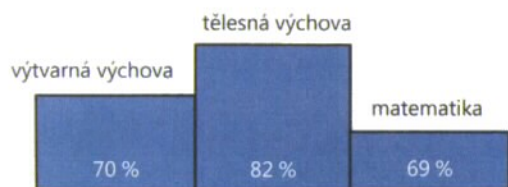
Nejoblíbenější předměty – 1. stupeň