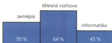
Nejoblíbenější předměty – 2. stupeň